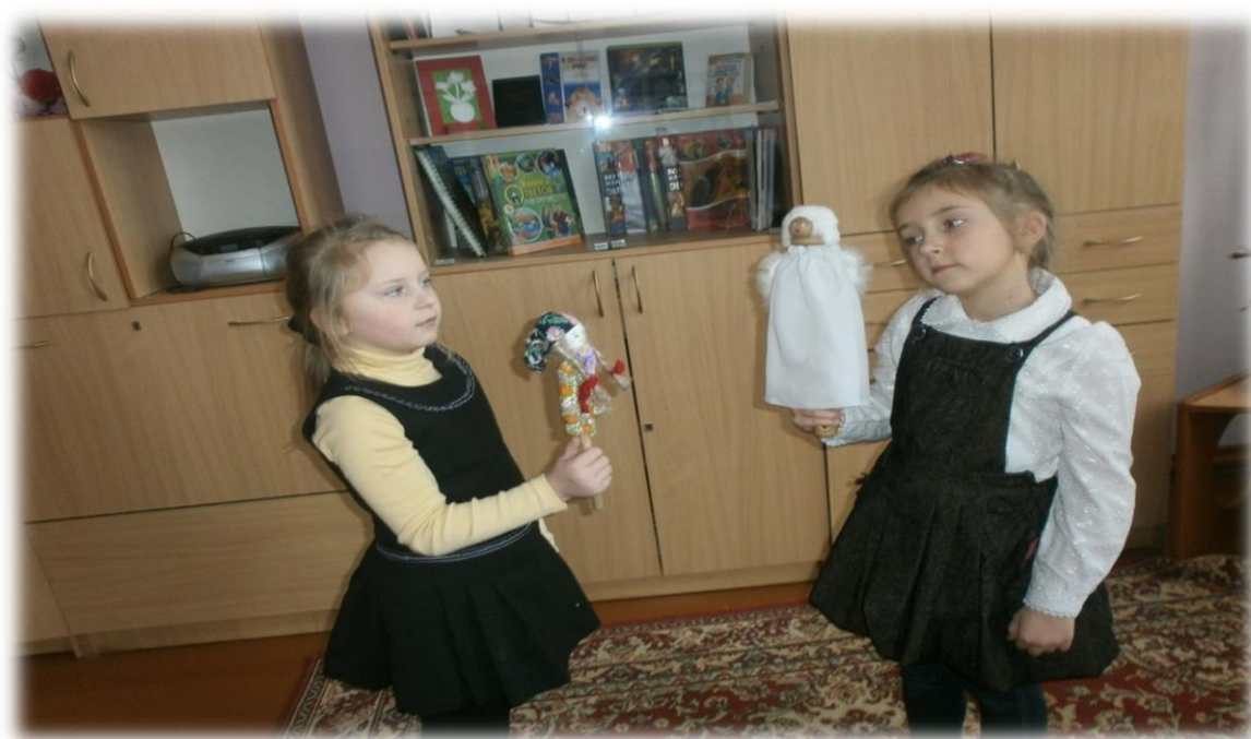
Первая репетиция с куклами

Рассказчик: И ей в ответ в очах святых, Как искры звезд, сверкнули слезы, И изо всех даров земных Христос-Младенец выбрал розы.. Б. Николаев