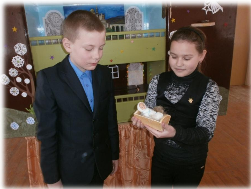
Рыхтуемца да выступлення

- У душы застаецца святасць, цудоўная ўзвышаная музыка, якая нікога не можа пакінуць абыякавым.