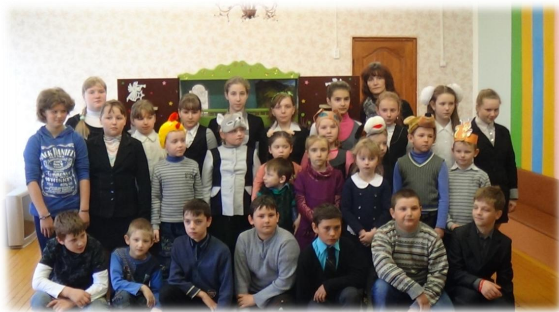
Выступленне ў сацыяльным прытулку в. Палужжа

Педагог. Вера ў Бога, імкненне да Бога дае заўсёды радасную надзею на лепшае. А радасць, асабліва для чалавека, які толькі пачынае жыць, павінна быць прывычным пачуццём, такім, як паветра. Ад таго, што наперадзе вялікае, цікавае жыццё, новыя сустрэчы, каханне, шчасце. Як гавораць мудрыя людзі, мы не заўсёды атрымліваем тое, што на самай справе патрэбна на канкрэтным этапе жыцця. Але перамагаючы цяжкасці, становімся сапраўднай асобай, здольнай зрабіць жыццё шчаслівым і прыгожым як для сябе, так і для ўсіх акружаючых.