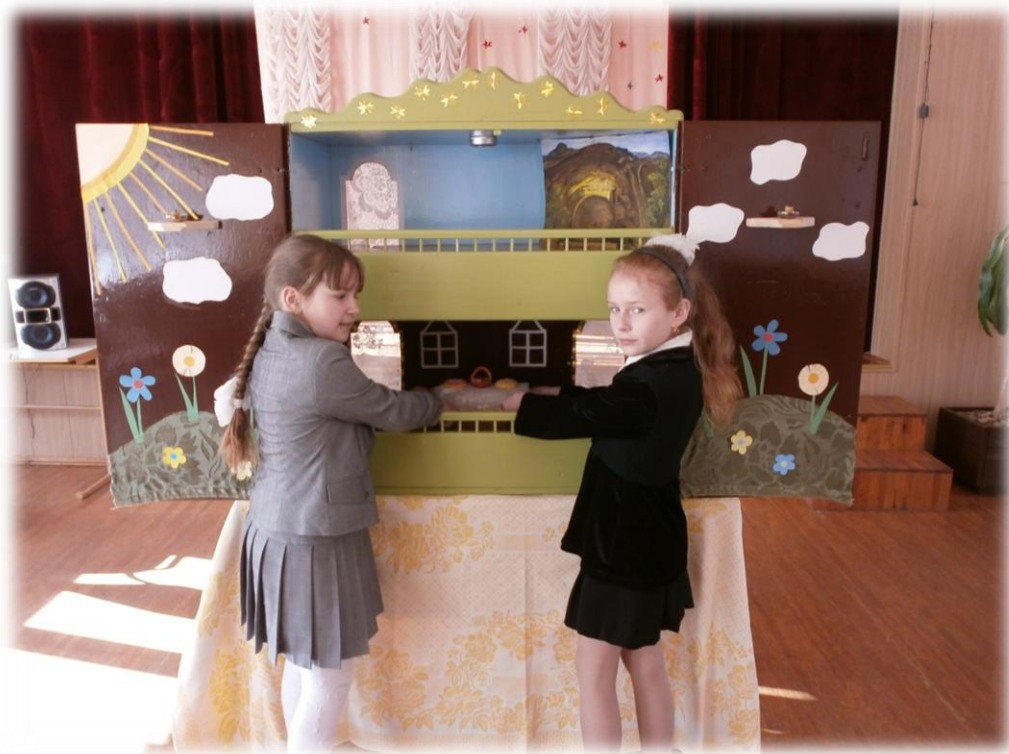
Падрыхтоўка да выступлення