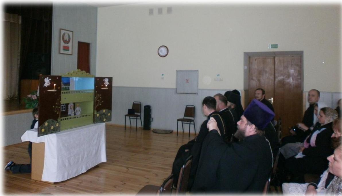
Выступление на чтениях, посвящённых духовно-нравственному воспитанию, в г.п. Кореличи