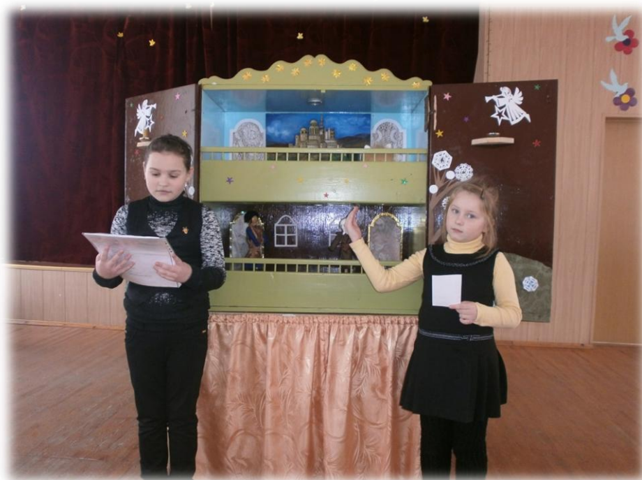
Рэнетыця п'сы "Самы каштоўны плод"