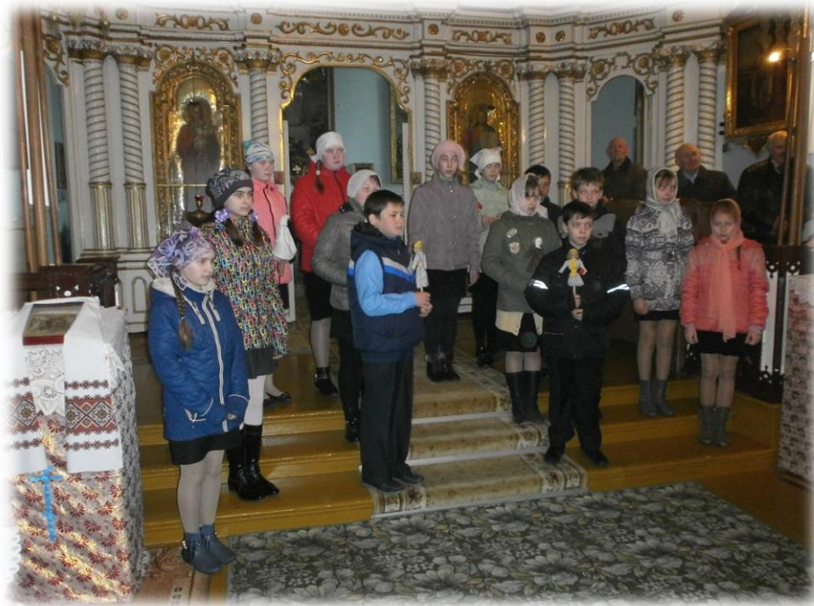
Выступленне ў Храме Свята Пакроўскай царквы в. Турэц